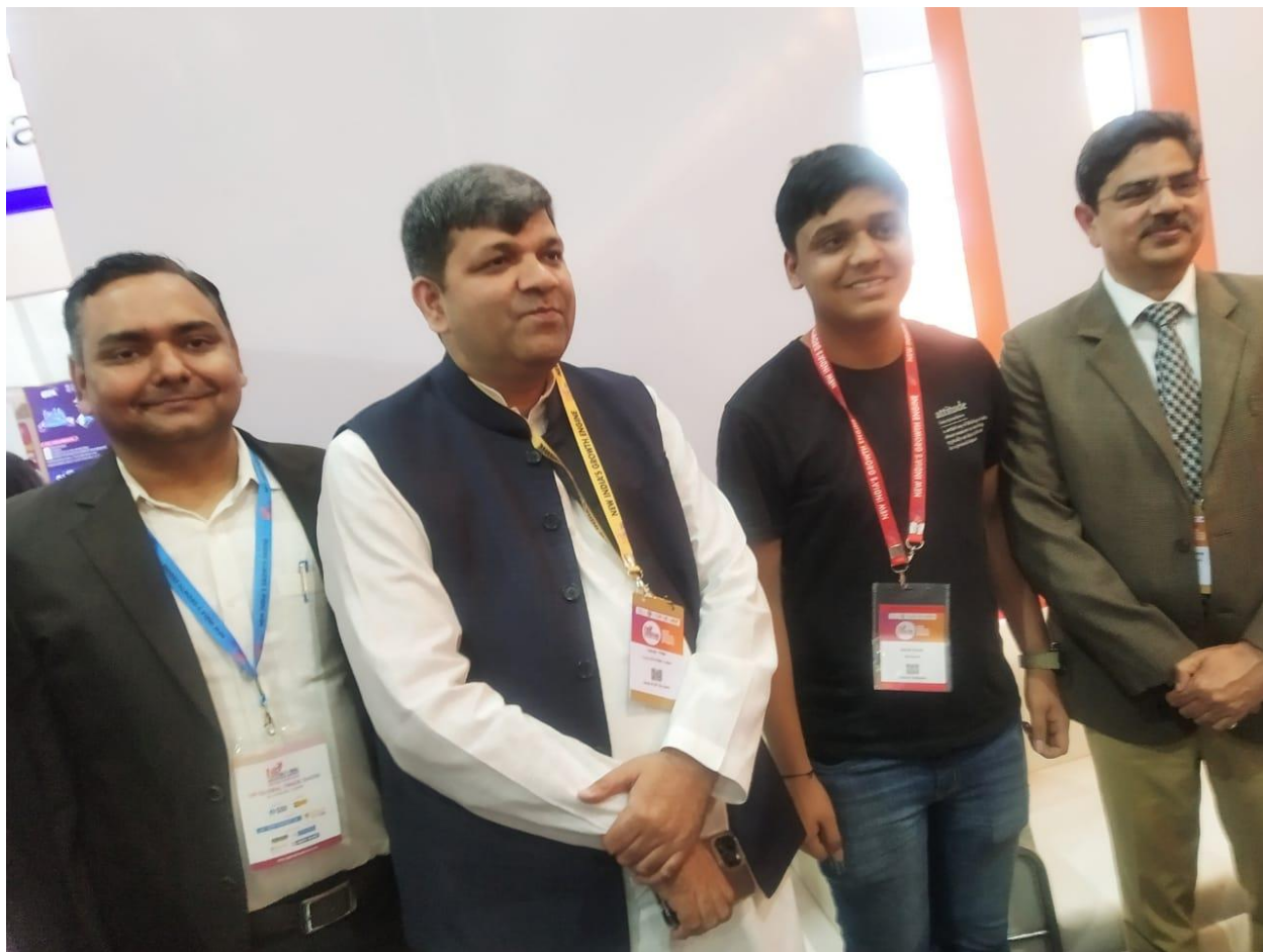
7 Honorable Minister of Technical Education and Vice Chancellor AKTU