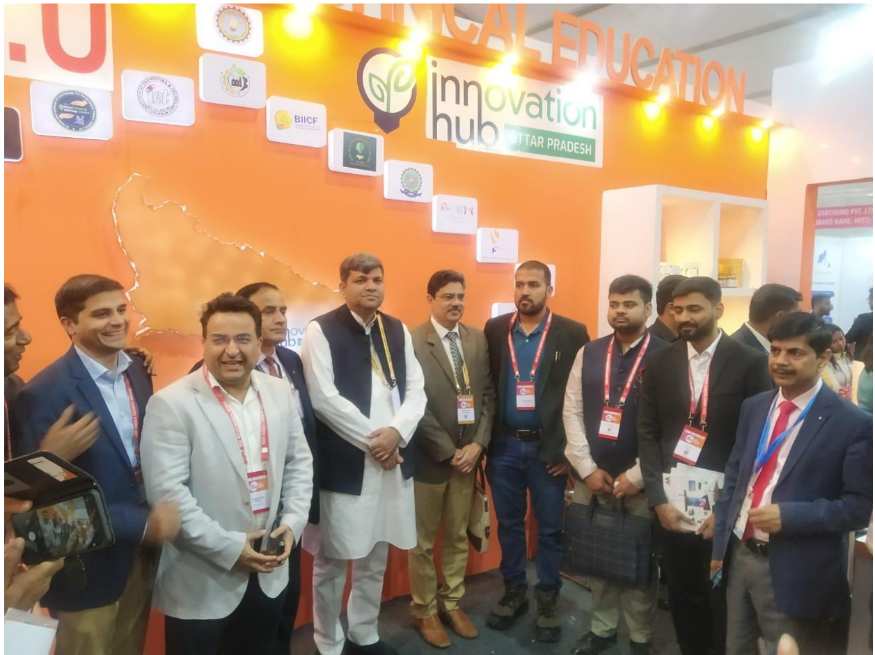
6 Investors with Honorable Minister Technical Education at AKTU Pavilion