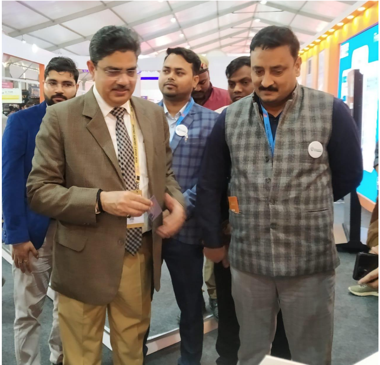
5 Honorable VC AKTU and Assistant Registrar