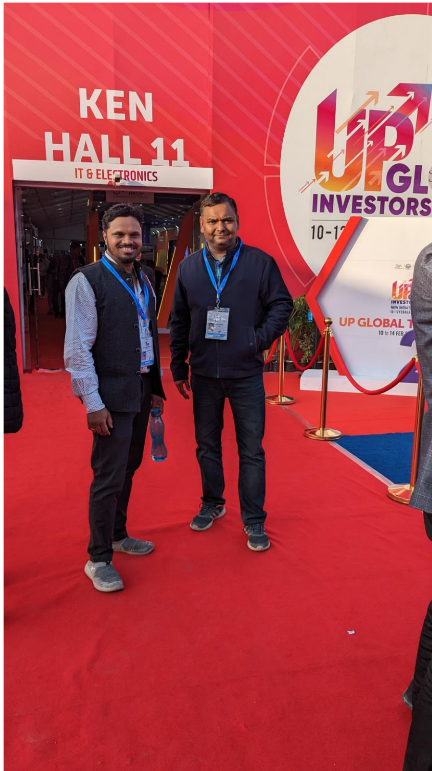
9 Directors Navachar Incubation Center , FoAP , AKTU