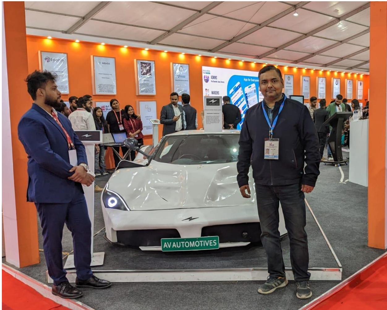
8 Director Navachar Incubation Center , FoAP, AKTU with AV Automotives