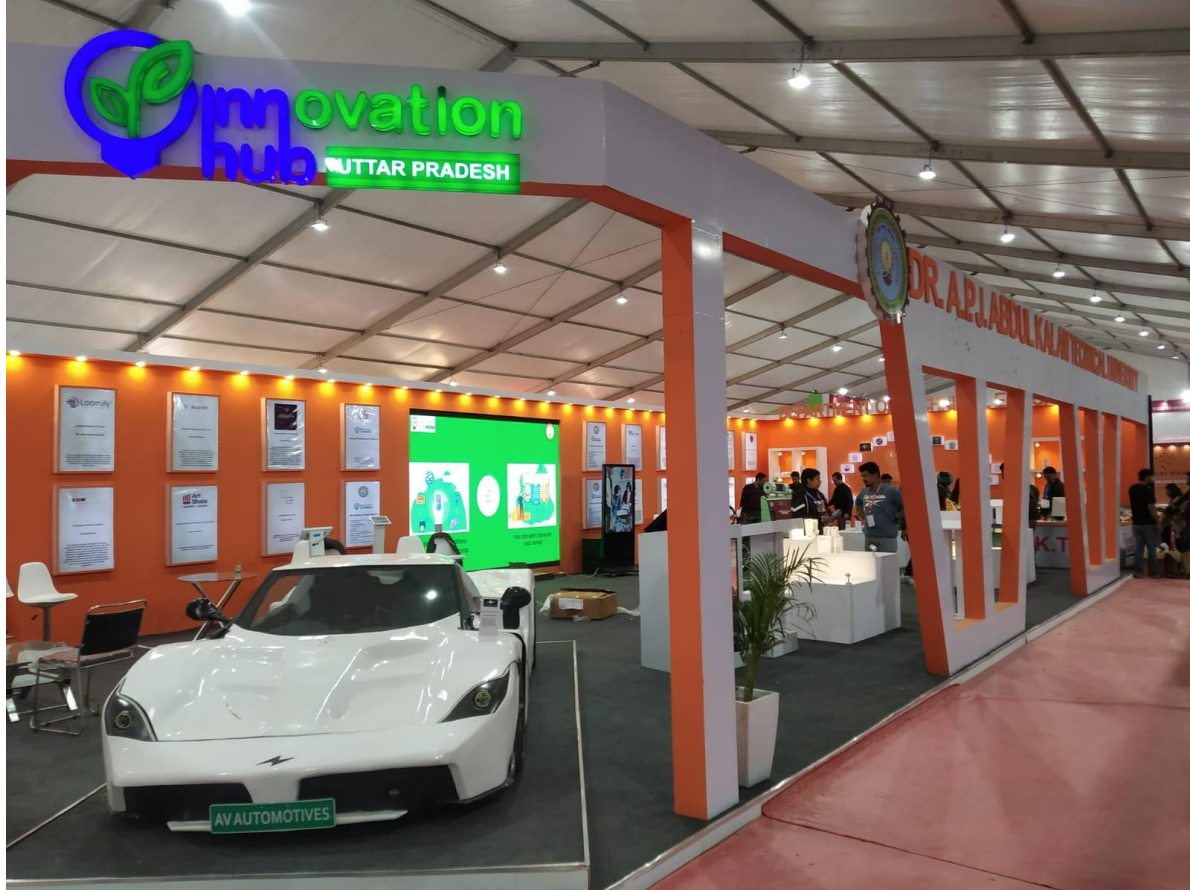
Figure 1 AKTU stall at GIS 2023, Hall 11 Ken

Navachar Incubation Center, Faculty of Architecture and Planning, AKTU, Lucknow has actively participated in Global Trade Show at Uttar Pradesh Global Investors Summit 2023, under the umbrella of Innovation Hub, Dr. A P J Abdul Kalam Technical University, Uttar Pradesh. A total of 6 startups are showcasing their ideas in Hall 11 Ken, to spread awareness and attract investors. All of these startups are a major attraction due to their innovative ideas and technological advancements.