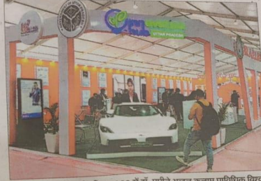
ग्लोबल इन्वेस्टर्स समिट-2023 में डॉ. एपीजे अब्दुल कलाम प्राविधिक विश्वविद्यालय की ओर से स्टार्टअप के स्टॉल लगाए गए हैं। इसमें विश्वविद्यालय के इन्वेंशन हब की ओर से प्रदेश के चुनिंदा 50 स्टार्टअप और नवाचार की प्रदर्शनी लगाई गई है।